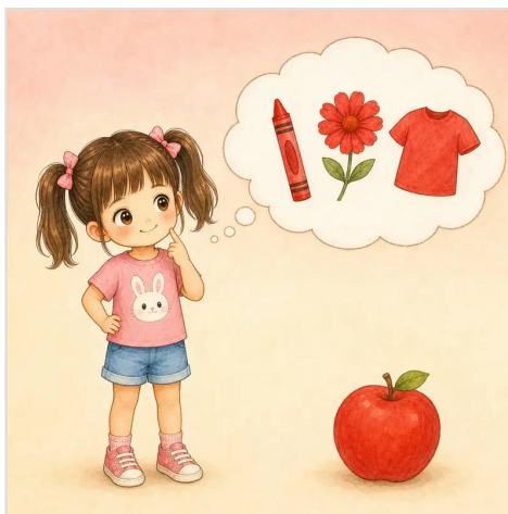
第 7 頁：蘋果是紅色的。