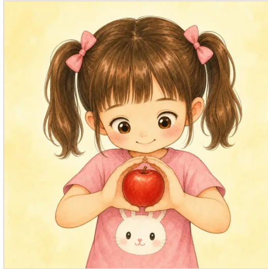
第 8 頁：蘋果是圓圓的。