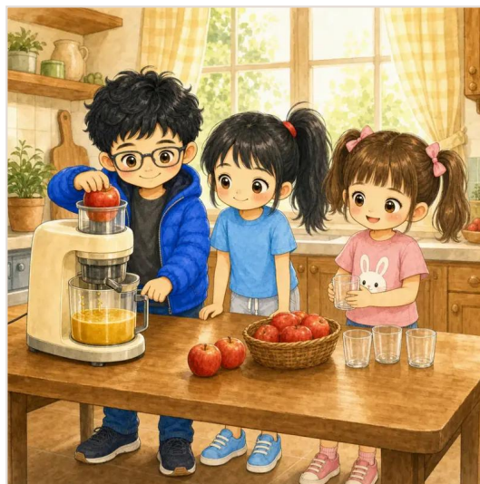
第 13 頁：波波做蘋果汁。