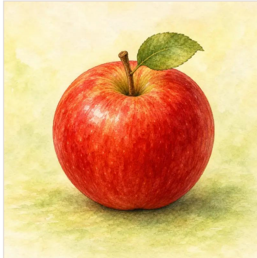
第 6 頁：這是一顆蘋果。

擴展 把回答延伸成更完整的句子 R 重複邀請孩子再聽或說一次。下面用三個畫面示範：